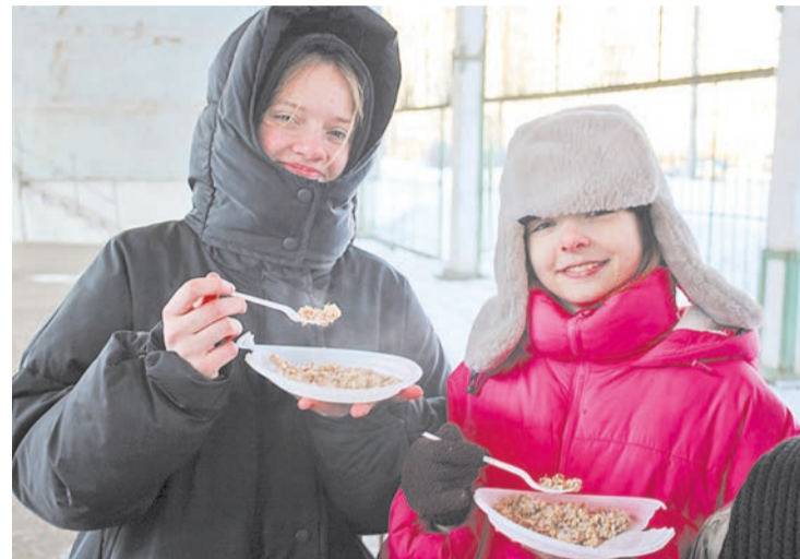
Вкусна да сытна солдатская каша!