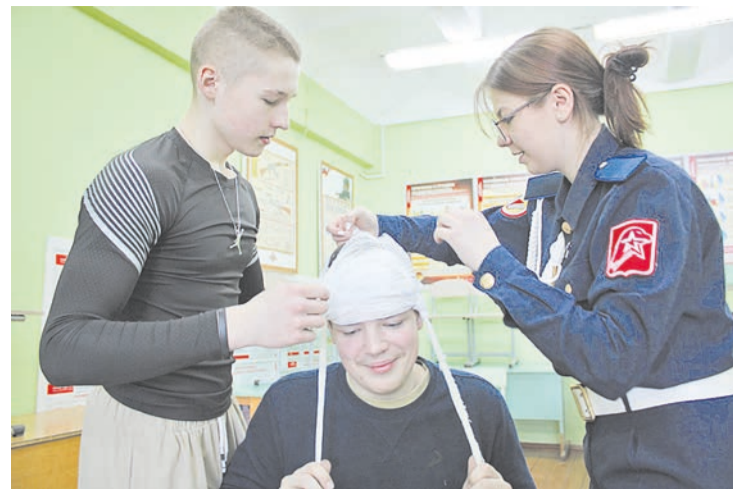
Старшеклассники школы № 7 научились правильно накладывать повязки раненым