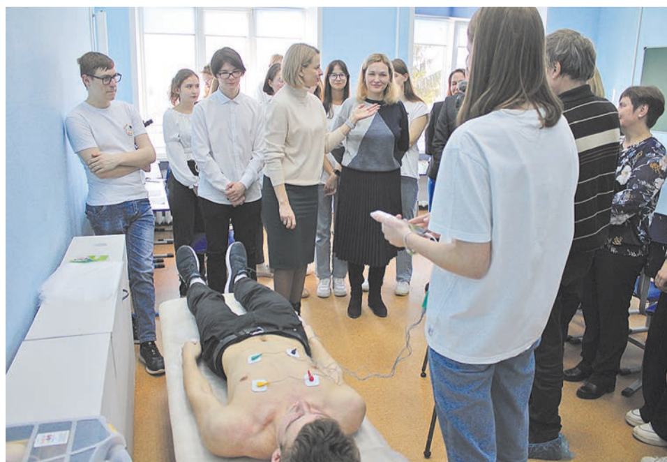
Гимназисты учатся снимать электрокардиограмму

В боровичской гимназии открылся медицинский класс